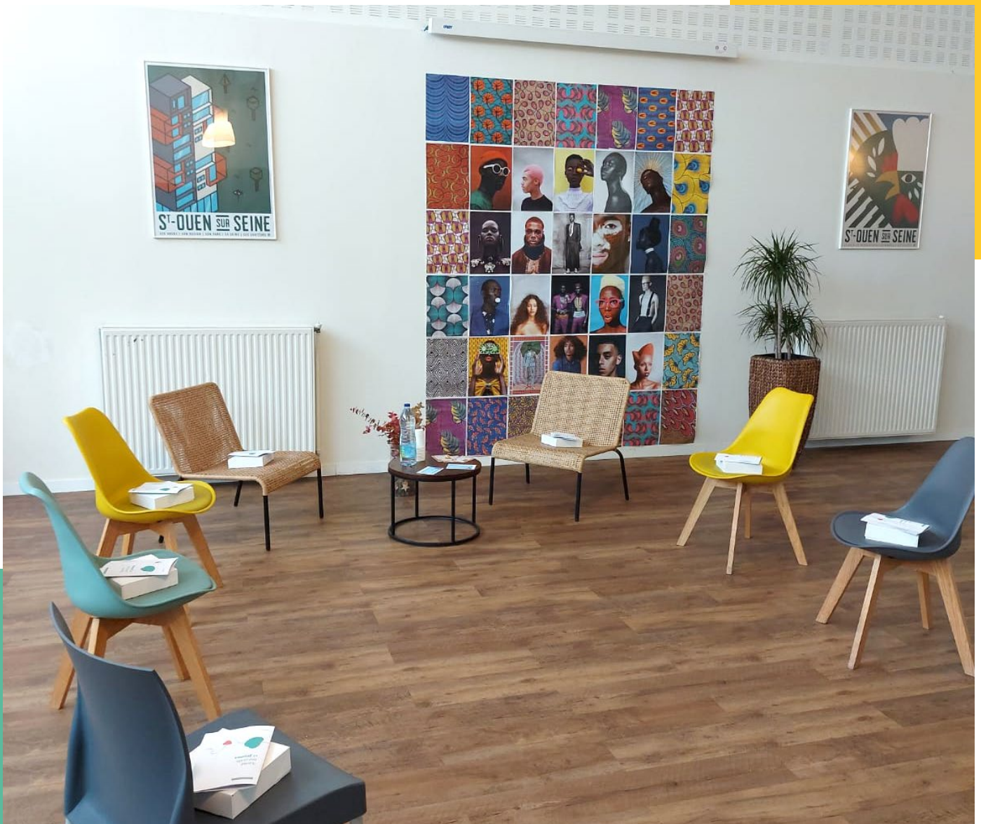
Action Santé Mentale – ALJT Saint Ouen

Réalisées par Alizée Guégan dans le cadre du cycle de l'URHAJ Ile-de-France à la reconquête des actions collectives !