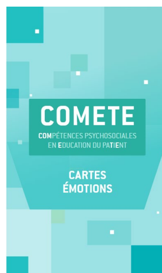
CRES région PACA Pour les cartes émotions .